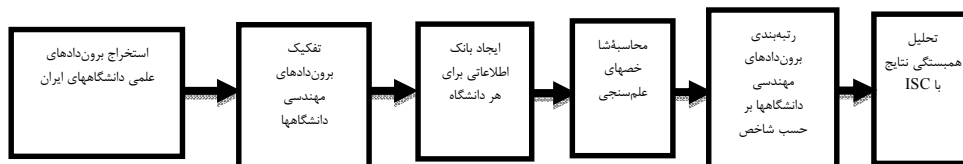
شکل ۱: فرایند اجرای پژوهش

در بین پژوهش‌های انجام‌شده پژوهشی مستند و قابل‌اتکا است که با تعیین روش صحیح انجام پژوهش و اجرای دقیق آن، اطلاعات خود را جمع‌آوری و نتیجه‌گیری کند. این پژوهش با توجه به نتایج آن برای محققان، دانشجویان، بخش‌های صنعت و دانشگاه‌ها و مؤسسات آموزش عالی کاربردی محسوب می‌شود؛ از نظر نوع پژوهش، یک مطالعه و بررسی کمی و شیوه گردآوری اطلاعات آن کتابخانه‌ای است. جامعه آماری پژوهش شامل تمام مقالات نویسندگان ایرانی با موضوعات مهندسی در پایگاه اطلاعات علمی استنادی اسکوپوس است. هدف اصلی این پژوهش رتبه‌بندی دانشگاه‌های ایران بر اساس برون‌دادهای علمی - مهندسی است؛ بنابراین، در حوزه وابستگی پایگاه اطلاعات علمی اسکوپوس کلمه «ایران» جست‌وجو شد و نام دانشگاه‌های دولتی وزارت علوم، تحقیقات و فناوری بیرون کشیده شد تا تمام نام‌های دانشگاه‌های ایران دارای برون‌داد علمی مشخص شد. در پایگاه اطلاعاتی حاصل تمام مقالات دانشگاه‌های ایران با موضوع مهندسی ۱ جست‌وجو و نتایج در بانک اطلاعاتی مجزا برای هر دانشگاه ذخیره شد. نتایج شامل ۸۵۰۹۷ مقاله طی سال‌های ۱۹۷۰ تا ۲۰۱۶ و زمان جست‌وجو و دریافت اطلاعات از پایگاه اطلاعات علمی مربوط به اوایل سال ۲۰۱۶ است. فرایند این پژوهش در شکل ۱ نشان داده شده است.