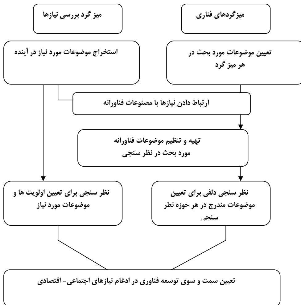
شکل ۵: مراحل ادغام نیازهای اجتماعی - اقتصادی

نیازهایی که در آینده باید توسط فناوری حل و فصل شوند، لازم است توسط اعضای میزگرد نیازسنجی تعیین و سپس، این یافته‌ها در میزگردهای فناوری برای بحث و بررسی عرضه شوند. در صورت امکان، پیشنهادهایی نیز بر فهرست موضوعات مورد بررسی توسط اعضای میزگردهای فناوری اضافه