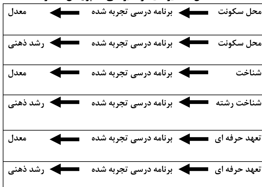
شکل ۲: مسیرهای مورد بررسی در پژوهش حاضر

می‌گردد. برنامه درسی تجربه شده شامل متغیرهای مهارت‌های عمومی، ادراک از محیط، خوداثربخشی و رضایت بود که در نهایت منجر به موفقیت دانشجو می‌شوند.