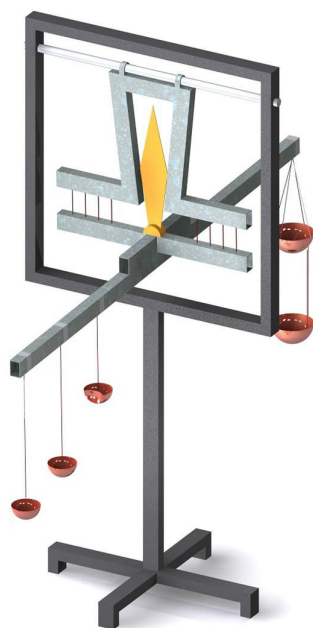
شکل ۳: ترازوی حکمت ساخته شده توسط سازمان پژوهش‌های علمی و صنعتی ایران

مرحله بعدی عیارسنجی است که قبل از اجرای آن بازوی چپ باید مدرج شود. به دلیل وجود خطا در محاسبه جرم مخصوص به روش خازنی، مدرج کردن ترازو از روش محاسباتی که در بخش ۱-۳ شرح داده شده، انجام می‌شود. عیار آلیاژی مرکب از آهن و آلومینیوم بنا بر توضیحات بخش ۳ سنجیده و نتایج مربوط به آن در جدول ۵ ثبت شده است.