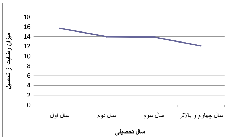
شکل ۱: میزان رضایت از تحصیل بر اساس سال

درواقع با تخصصی شدن دروس، میزان رضایت از تحصیل کاهش یافته است. با توجه به خاص بودن رشته مهندسی راه‌آهن، بسیاری از دروس از منابع درسی بین‌المللی برخوردار نیستند که تدریس را برای استادان دشوار می‌سازد. به همین ترتیب، همان‌طور که شکل ۲ نشان می‌دهد ارزیابی از تسلط علمی استادان (پرسش ۱۴) نیز بر اساس سال تحصیلی دانشجوی روند کاهشی داشته است.