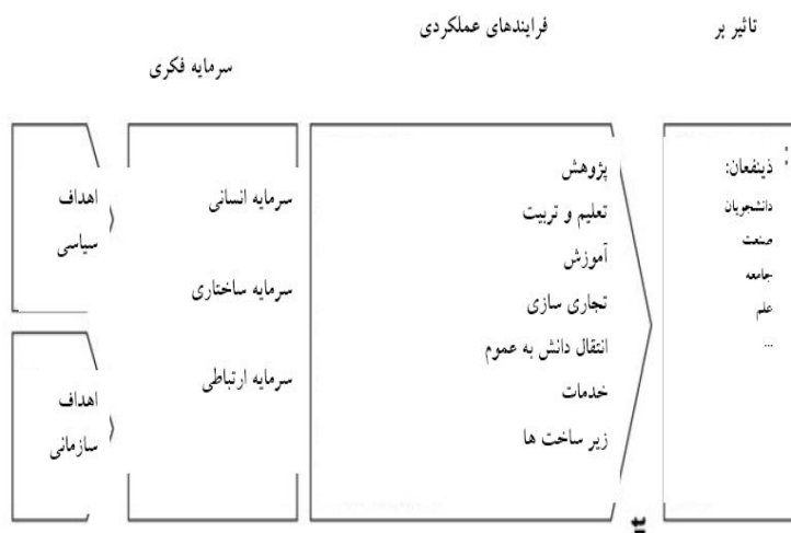
شکل ۱: مدل ارزیابی سرمایه فکری دانشگاهی لایتنر

لایتنر (۲۰۰۲) بر اساس دیدگاه سیستمی و با توجه به سه مؤلفه اصلی سرمایه فکری، مدل ارزیابی سرمایه فکری دانشگاهی را تدوین کرده است. در این مدل برای آگاهی مدیران دانشگاهی در تشخیص اینکه "چه مؤلفه‌هایی از سرمایه فکری" باید ارزیابی شود، توجه آنان را به تعیین اهداف سیاسی و سازمانی معطوف می‌دارد و سپس، با توجه به سه مؤلفه اصلی سرمایه فکری، برای ارزیابی سرمایه‌های نامحسوس دانشگاه چارچوبی ارائه می‌کند. فرایندهای عملکردی در این مدل و تأثیرات ارزیابی سرمایه فکری بر ذینفعان داخلی و خارجی دانشگاه نقش مهمی ایفا می‌کند [۱۹]. نمای کلی مدل در شکل ۱ نشان داده شده است.