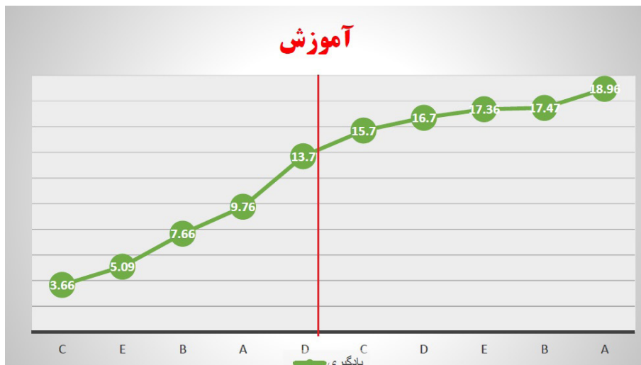
نمودار ۲: پیشرفت یادگیری