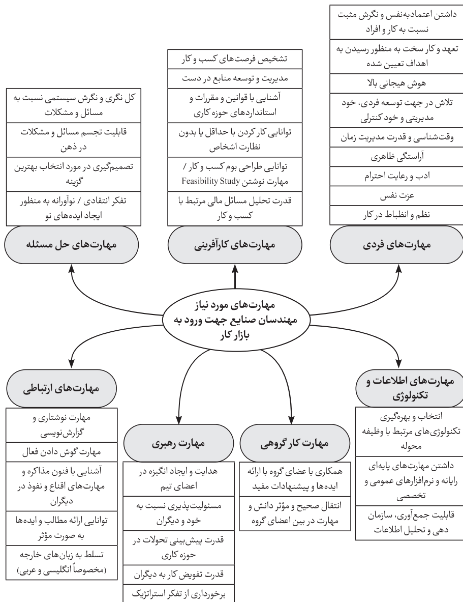
شکل ۲. مدل نهایی مهارت‌های مورد نیاز مهندسان صنایع جهت ورود به بازار کار

پس از تأیید مدل پژوهش با استفاده از روش معادلات ساختاری، اکنون به اولویت‌بندی مهارت‌های مورد نیاز مهندسان صنایع در ۷ دسته مهارت‌های ارتباطی، مهارت‌های حل مسئله، مهارت‌های کار گروهی، مهارت‌های اطلاعات و فناوری، مهارت‌های کارآفرینی، مهارت‌های رهبری و مهارت‌های فردی