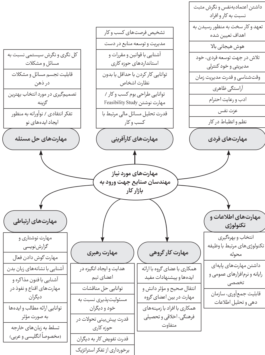
شکل ۱. مدل مفهومی اولیه از مهارت‌های مورد نیاز مهندسان صنایع جهت ورود به بازار کار