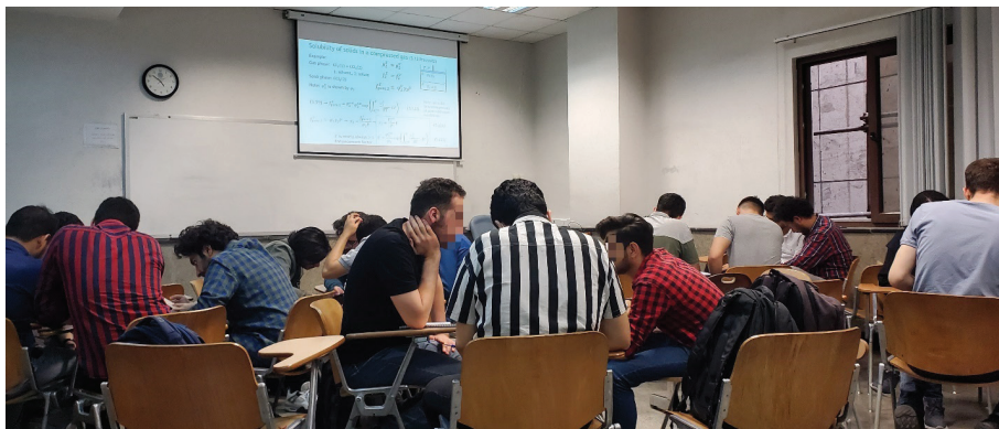
شکل ۲. نمونه‌ای از فضای کلاس ضمن یادگیری فعال، نوع فعالیت: یادگیری بخشی از درس که مشابه بخش‌های آموزش داده شده توسط استاد است. کلاس ترمودینامیک مهندسی شیمی پیشرفته کارشناسی ارشد دانشکده مهندسی شیمی، دانشگاه صنعتی امیرکبیر

و کسر مولی فاز بخار با داشتن دما و کسر مولی فاز مایع، یادگیری انواع دیگر محاسبات تعادل بخار-مایع در قالب مباحثات گروهی اتفاق می‌افتد. در طی این نوع فعالیت کلاسی، استاد در کلاس و بین گروه‌ها حرکت می‌کند و به تسهیل فرایند یادگیری و رفع اشکال می‌پردازد. شکل ۲ نمونه‌ای از فضای کلاس ضمن انجام این نوع از فعالیت را نمایش می‌دهد. معمولاً پایان فعالیت با جمع‌بندی توسط یکی از دانشجویان و ذکر نکات احتمالی و اصلاحات لازم توسط استاد همراه است. نمونه دیگر فکرکردن و تحلیل مسیر حل یک مسئله به صورت فردی یا گروهی بر اساس درس همان جلسه است. در برخی از جلسات، در ابتدای کلاس و پیش از مرور درس جلسه قبل، از هر دانشجو خواسته می‌شود در یک یا دو جمله، موردی که از درس جلسه گذشته یا مطالعه معین شده قبل از کلاس متوجه نشده است را بنویسد. در ادامه فرصت چنددقیقه‌ای داده شود که دانشجویان در قالب گروه‌های دونفره یا بزرگتر، در رابطه با این موارد مباحثه کنند. برای جلوگیری از استرس در دانشجویان، تأکید بر فضای امن کلاس و ایجاد فضایی به دور از توهین، سرزنش یا قضاوت در صورت پاسخ اشتباه، تأکید بر فرصت یادگیری و تشویق دانشجویان، کمک‌کننده است.